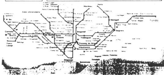
Calendari del catàleg

moments, però només són dos per any, que és molt poca quantitat, i a més són reeditats. Aquest any els títols són Lo que el viento se llevo i Una noche en la opera , dels germans Marx.