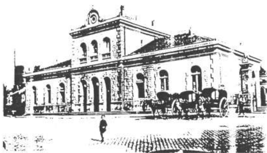
J. B. Terrassa — Estación del Norte 20

Observar les sèries de postals antigues permet traslladar la imaginació a temps passats. Assenyalem com a curiositats de la sèrie JB els carruatges que a les sortides de les estacions esperaven l'arribada de passatgers (núms. 1 i 20), i la circulació de carros pels carrers (núms. 2,3,6,9,18 i 23) superior a la d'automòbils, que només apareixen en les postals 16 (matrícula B-15186), 21 i 23 (B-23131). En la número 9 veiem un dels autobusos del primer servei a Terrassa, inaugurat per la Festa Major de 1927. En la núm. 5 de l'Escola Industrial, observem com ja llueix a la façana l'escut de la ciutat, així com la paret i la barana que tancava el pati. En la núm 19, de les Escoles Pies, podem constatar les restes de les cintes ja arrencades que ornaven els laterals de l'escut de la façana, obra d'en Llimona.