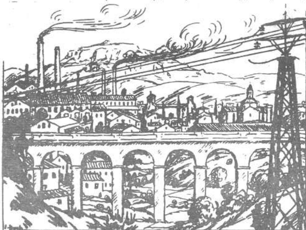
"Dibuix simbòlic de la ciutat de J. Duch a visions de Catalunya de J. Santamaria.

Bibliografia: Maria Coll. 1) A-2624, 2) A-2630, 3) A-2616 4) No catal. 5) A-2634, 6) A-2619, 7) A-2633 8) A-2629, 9) A-2626 10) A-2617, 11) A-6133/4. Rareses: C. (Corrent); E (Escassa); R (Rara); RR (Molt rara); RRR