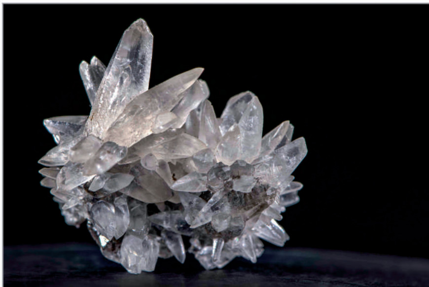
Calcita. Carbonat de calci. Mané del Puig, Queralbs, Catalunya.