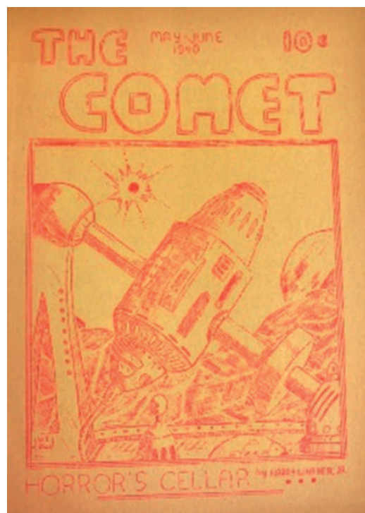
Fanzine The Comet

I acabarem a Denver (EUA) amb la visita d'una de les col·leccions més grans del món: https://denverzinelibrary.org/