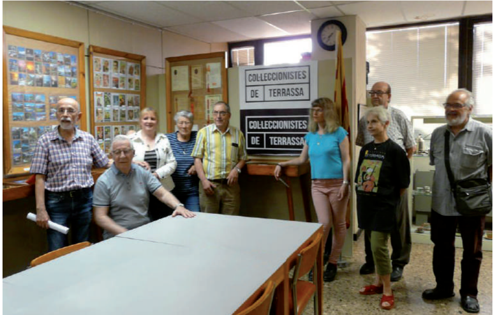
Els socis en la inauguració de l'Exposició Col·lectiva