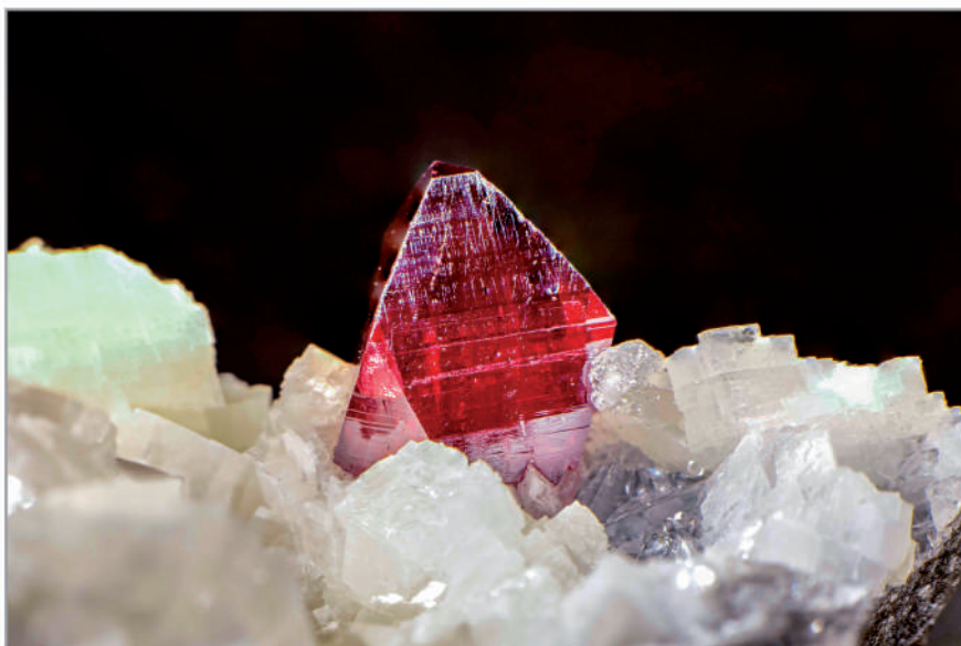
Cinabri i dolomita. Sulfur de mercuri, carbonat de calci i magnesi. Mina Chatian, Fenghuang Co, Xiangxi, Hunan, Xina.