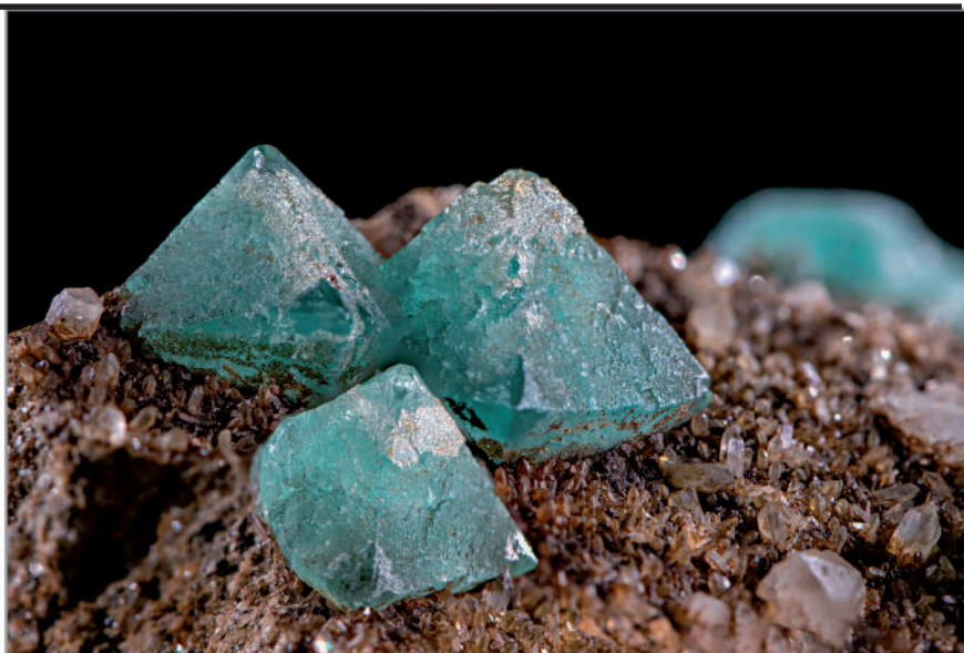
Fluorita sobre un llit de cristalls de quars. Fluorur de calci. Pedrera Berta, Sant Cugat del Vallès - El Papiol, Catalunya.