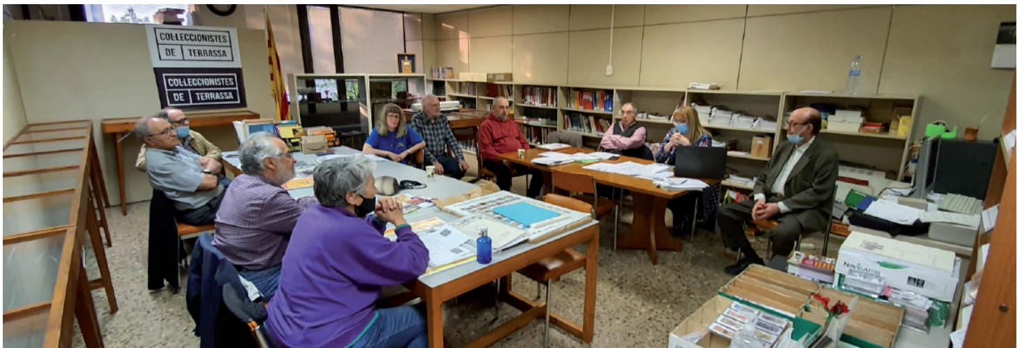
Assemblea del 2021, celebrada el 29 d'abril