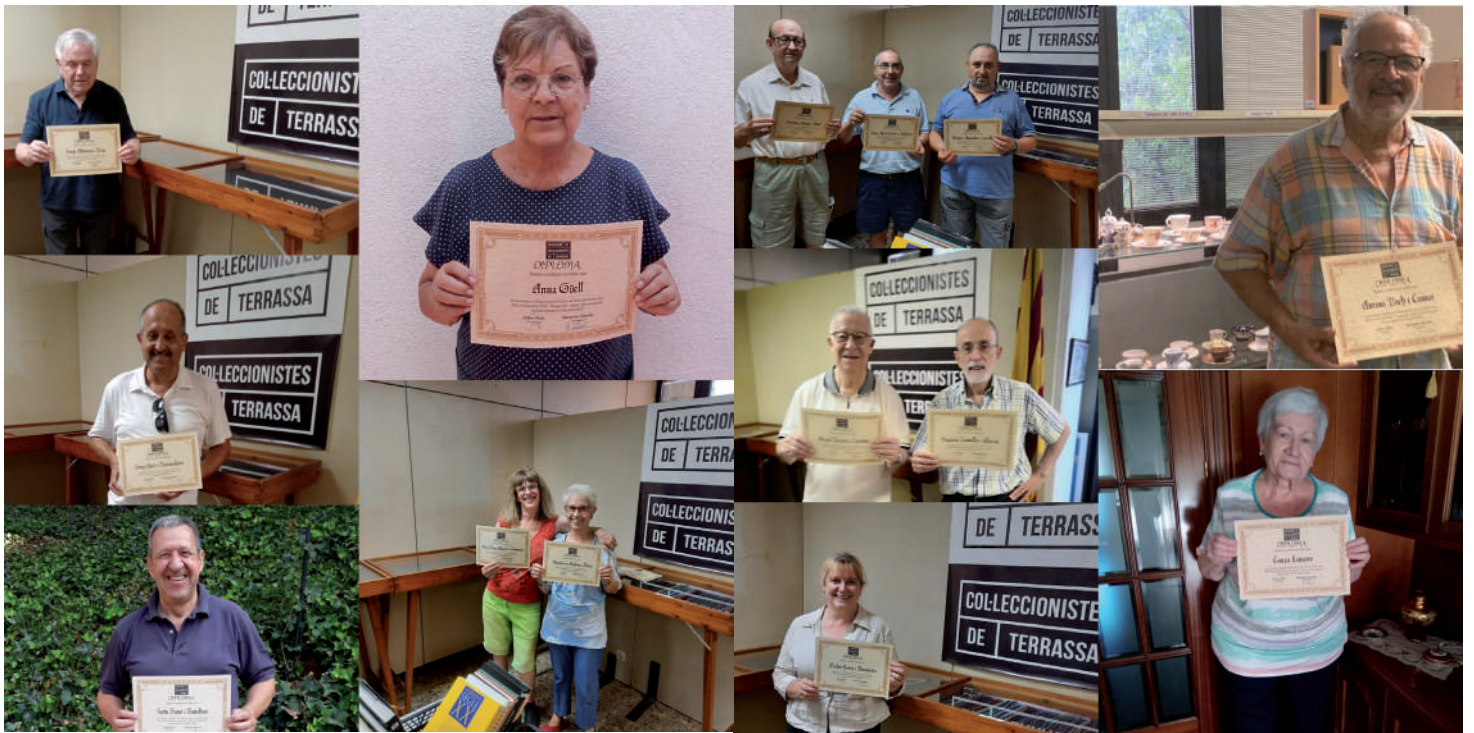
Els socis recollint el diploma per la seva participació a l'Exposició Col·lectiva