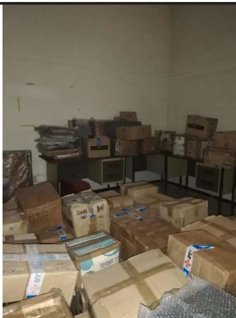
Caixes amb els còmics amuntegades en un magatzem municipal de Terrassa

Des del passat 18 d'agost el volum del material es troba custodiat a Terrassa, com a resultat d'un treball amb uns esforços units per part de les tres entitats, perquè, com dèiem, un material de gran valor cultural com aquest no es podia deixar perdre. Encara queda molta feina per fer: classificar, crear un arxiu, condicionar l'espai i, finalment, que tots els còmics vegin la llum