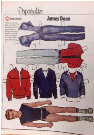
Figura de James Dean retallable