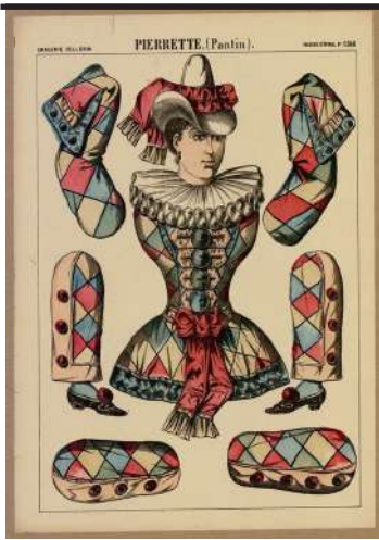
Pantins de Pierrette (1850)