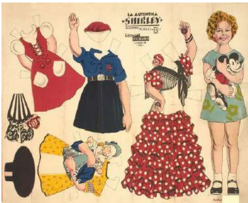
Full dedicat a Shirley Temple però amb un vestit clarament feixista