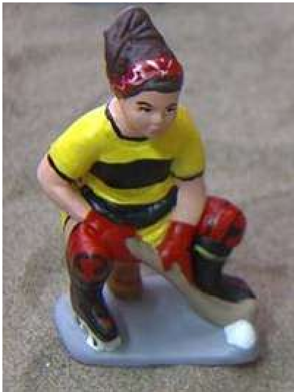
Figureta del caganer de Les de l'Hoquei