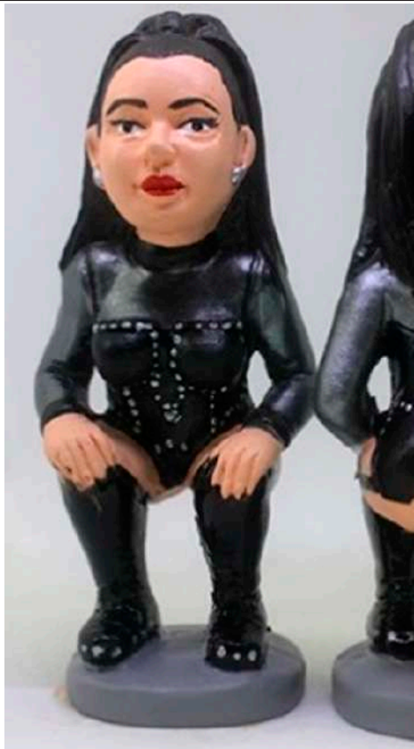
Figureta del caganer de Rosalía