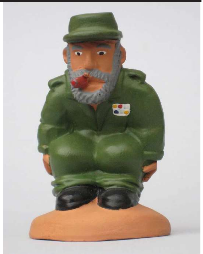
Figureta del caganer de Fidel Castro