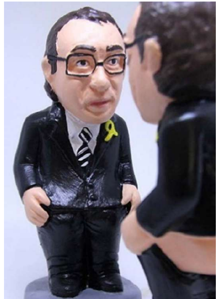
Figureta del caganer de Josep Rull