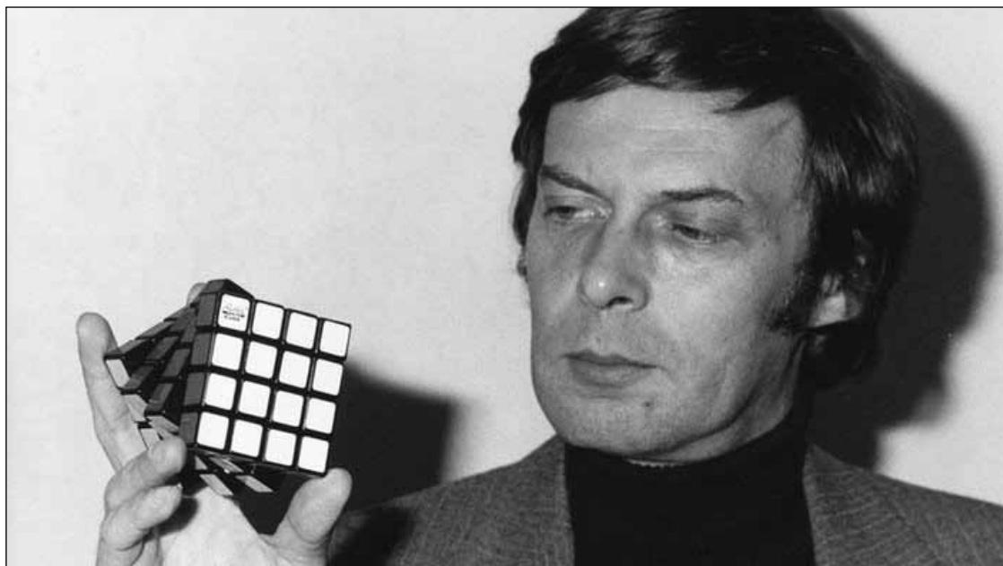
Ernő Rubik amb el seu invent "Cub Màgic"