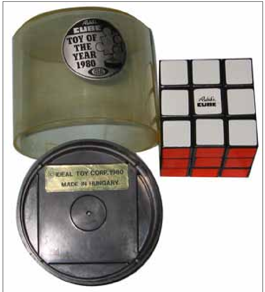
Cub de Rubik original de 1980 amb el seu estoig

A Terrassa no tenim coneixement que se n'hagin fet campionats oficials, però sí trobades com la del 19 de març del 2017 al Viena del Parc Vallès, on es van resoldre puzzles de tot tipus i es va fer un petit torneig de caràcter informal.