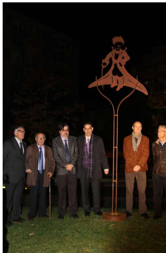
Inauguració de l'escultura El petit príncep.

No podia faltar, tampoc, un espai d'un col·leccionista que ens mostra els 708 llibres en 211 llengües que ha aconseguit arreplegar: http://www.annalittleprincecollection.com/ . I si en voleu veure una d'un col·leccionista espanyol, entreu a http://www.el-principito.es/