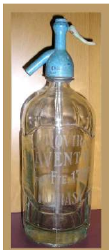
Sifons de la casa A. Dalmases, Ramoneda i Rovira i Raventós.

El sífó és un recipient, generalment de vidre o d'acer, amb tap fix o enroscat proveït d'una vàlvula. La vàlvula resta tancada, llevat de quan és accionada per una petita palanca i mentre hom l'acciona. El recipient conté o pot contenir aigua carbònica artificial.