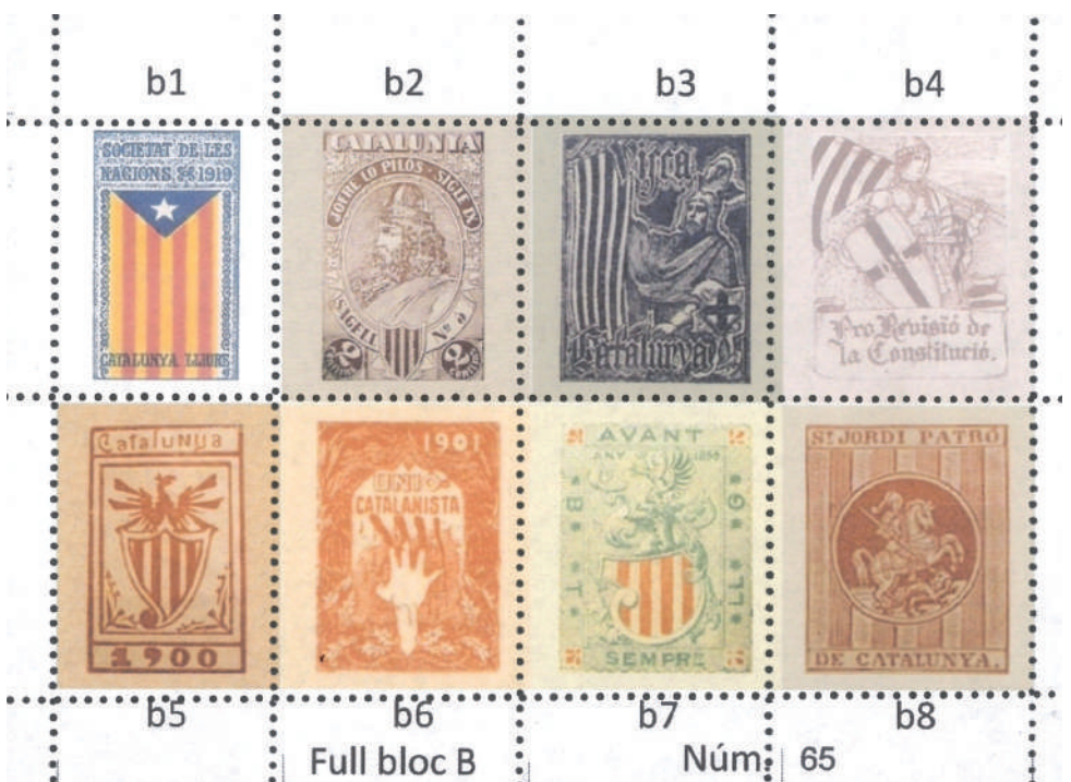
Vinyetes nacionalistes, Full bloc B