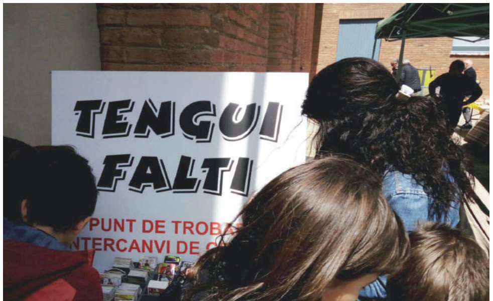
Punt d'intercanvi de cromos al pati del mNACTEC