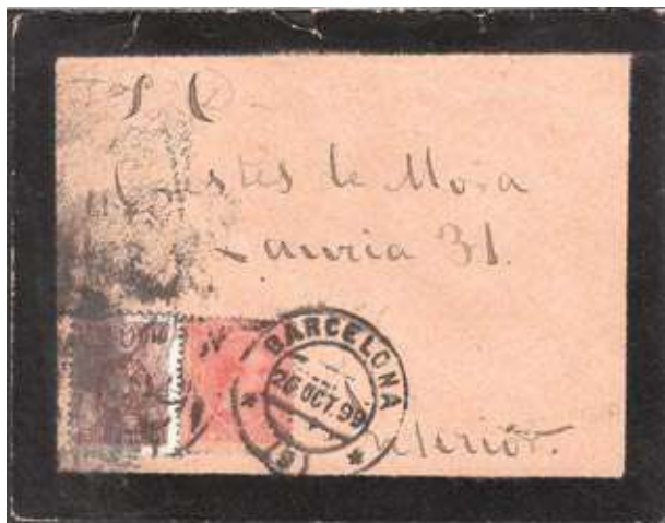
Circulada de Barcelona a Barcelona, en un sobre de carta de dol amb la vinyeta taxada per eliminar-ne la publicitat.