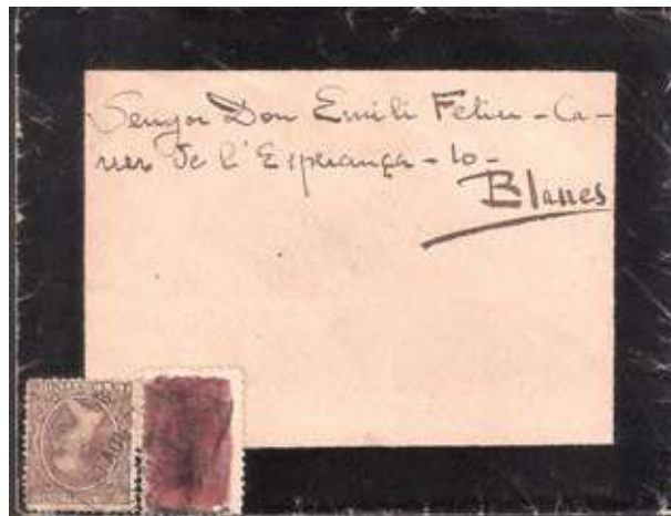
Circulada de Celrà a Blanes el 14 de novembre de 1900. La vinyeta de la sèrie núm. 2 està esborrada amb molta cura de no fer-ho amb els segells.