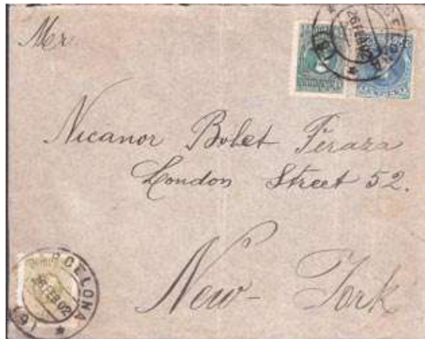
Circulada de Barcelona a New York, obliterator d'origen tant a la vinyeta com al segell de correus.