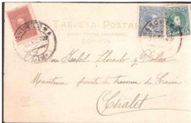
Circulada de Barcelona a França, obliterator d'origen a la vinyeta i als segells de curs legal.