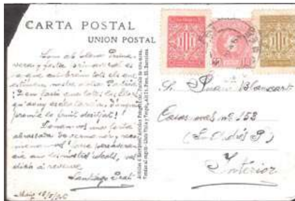
Circulada de Barcelona a Barcelona, postal oblitorada a origen tant les vinyetes com el segell de correus.