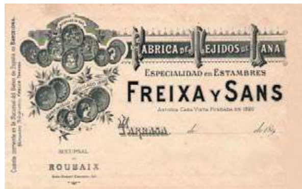
Bonica capçalera de carta de finals del segle XIX

I ara, estimats consocis i amics, fruïu d'aquest Butlletí a tot color, com a excepció per a aquest número 500 imprès en paper. Les vinyetes de Ricardo Alavedra que il·lustren les diferents pàgines són també un motiu de celebració afegit per a celebrar aquest 500 que ja esteu llegint. Gràcies a tots els qui heu fet possible assolir aquesta fita.