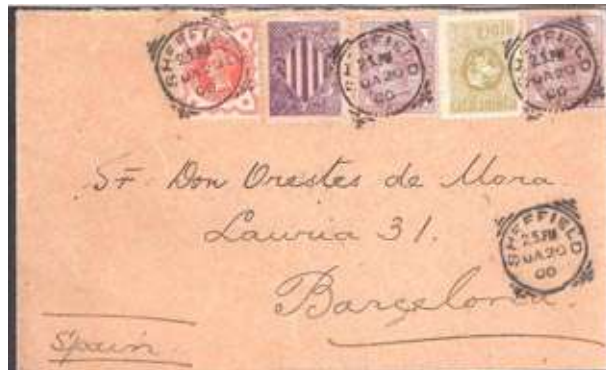
Circulada d'Anglaterra a Barcelona, obliterator d'origen a la vinyeta i als segells de curs legal.