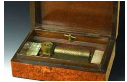
Capseta antiga de fusta Charles Reuge

Però no podem deixar de citar Charles Reuge, http://www.reuge.com una empresa suïssa fundada el 1865 que, a més dels seus coneguts rellotges de butxaca, es va especialitzar en mecanismes musicals que han estat incorporats en multitud d'objectes, com per exemple joiers, polvoreres, encenedors, autòmats, caixes musi-