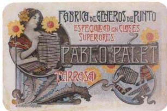
Anunci Fàbrica de Géneros de Punto de Pablo Palet que va servir de base per fer el cartell de la Fira Modernista de Terrassa del 2008.