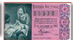
Dècim de loteria del 1960