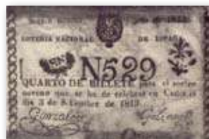
Bitllet de loteria del 1813 a Cádiz

També podem visitar el lloc web www.loterofilia.es dedicada al col·leccionisme de loteria en totes les facetes i èpoques, i per finalitzar http://loteriacoleccion.com per als qui desitgin una botiga on-line especialitzada en la venda de dècims per a col·leccionistes.