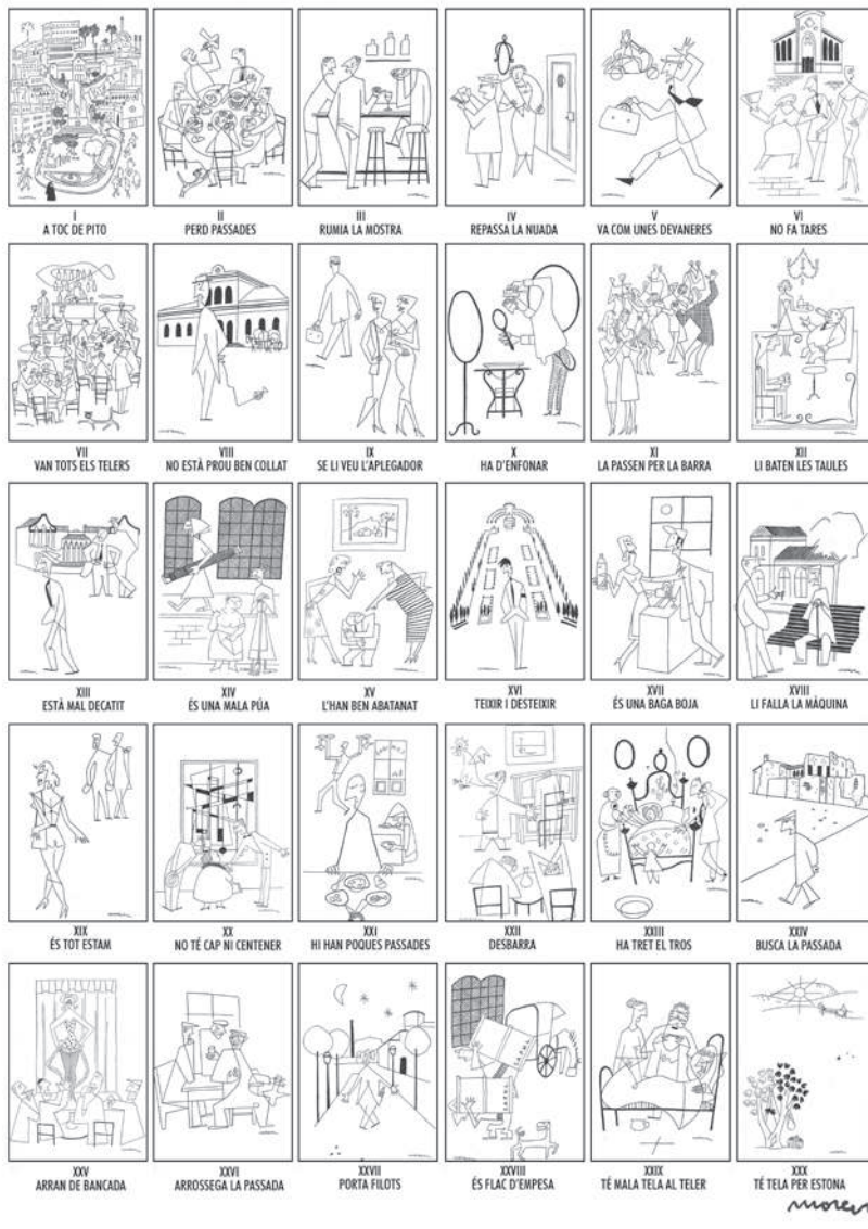
Al revers s'expliquen totes i cadascuna de les frases fetes.