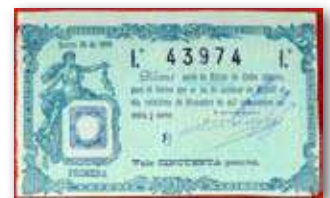
Dècim de loteria del 1889