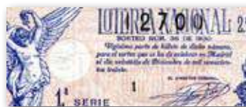
Dècim de loteria del 1930