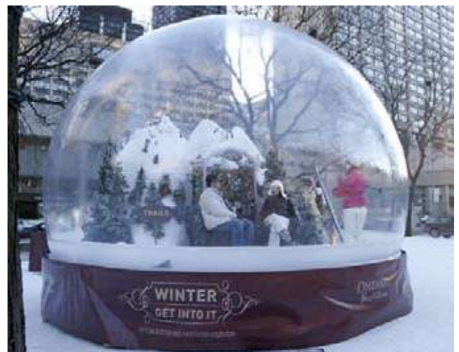
La bola de neu més gran del món a Ontàrio - Canadà

I com que hem començat destacant un espai en el món de les xarxes socials avui acabarem igual recomanant un espai a Pinterest anomenat: https://www.pinterest.com/kitschycupcakes/snow-globe-world/ on segur que passareu una bona estona tafanejant la quantitats de fotografies que hi ha.