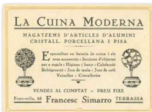
Anunci de la Cuina Moderna a la revista Lum Novella dels anys 20 del segle passat.