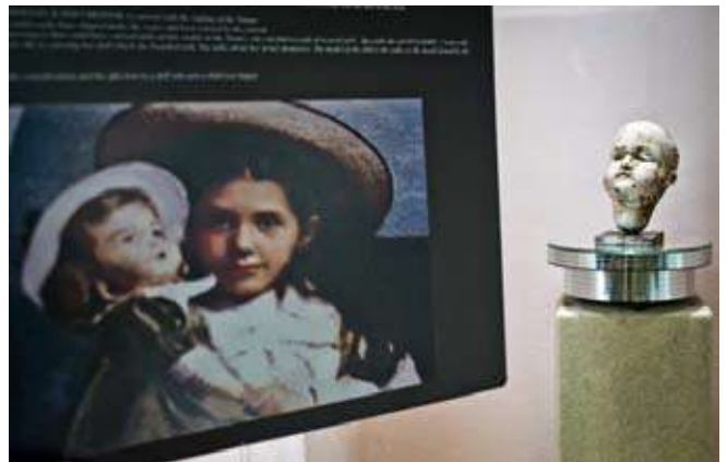
A la foto podem veure el que queda de la nina al costat d'una fotografia de la nena que la portava en el Titànic l'any 1912