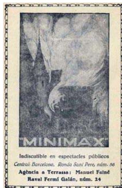
Anunci a l'opuscle editat en motiu de la inauguració del Cinema La Rambla, l'11 d'abril del 1935.

També es va parlar de la necessitat de canviar la ubicació de la Fira-Mercat d'intercanvi, promoció del col·leccionisme i antiguitats degut a la nova ordenació d'espais del Centre Cultural Terrassa. La junta directiva, d'acord amb representants dels socis paradistes, està fent actives gestions per tal de trobar el lloc més idoni. Tant l'Ajuntament com l'Associació i els socis paradistes tenim interès i sumem esforços per no estroncar aquesta positiva experiència de més de tres anys. Tingueu la seguretat que trobarem el lloc millor d'entre els possibles. Al seu moment serà comunicat a tothom i indicat amb un rètol visible al porxo on hem fet la fira fins ara.