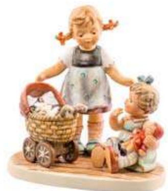
Figura Hummel cotxet