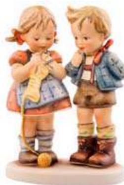
Figura Hummel dos nens