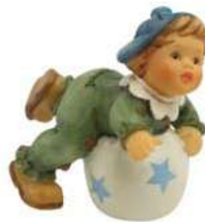
Figura Hummel circ

I finalitzarem el nostre "tour" virtual per aquest món tant curiós en un espai de venda de figuretes antigues, més que res perquè veieu a quins preus es cotitzen http://listado.mercadolibre.com.ar/para-coleccionistas-de-porcelanas-hummel .