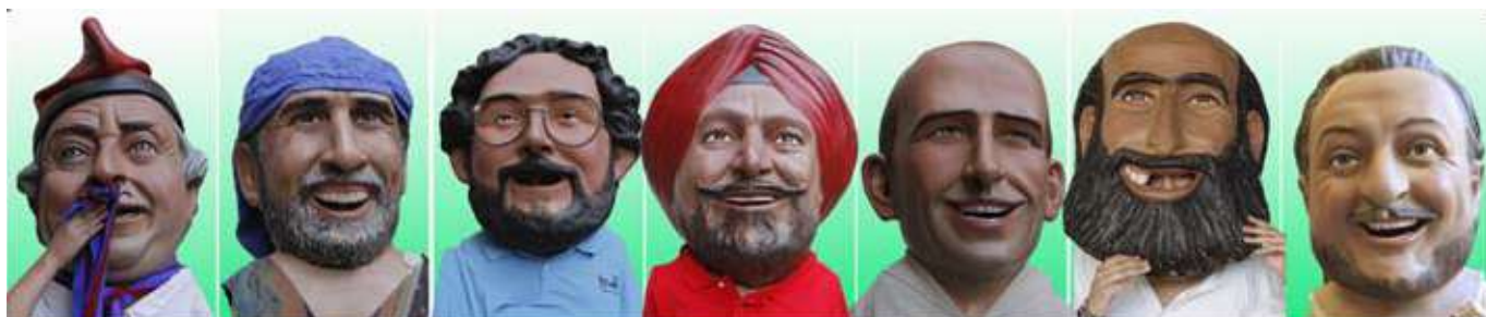
29. Ramon del Barça