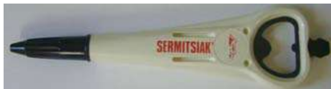
Bolígraf de propaganda de Groenlàndia amb un obridor incorporat

Tanquem avui aquest recorregut a una de les utilitats que molts de vosaltres encara recordareu de fa uns anys enrere que tenien els "bolis" BIC i que no era altra que permetre enrotllar les cintes dels cassetes. Segur que molts de vosaltres ho recordareu, oi que sí?