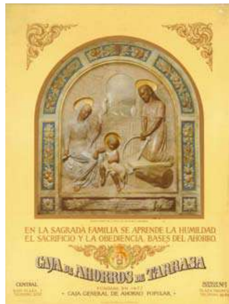
Un calendari de davantal del segle passat de Caixa d'Estalvis de Terrassa, que reproduïx un relleu de la Sagrada Família que hi ha a la capella de la Llar Torres Falguera. El va editar la impremta de Terrassa S. Salvatella.