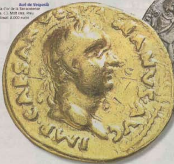
Auri de Vespasià Moneda d'or de la Tarraconense (70 a. C.). Molt rara. Preu estimat: 8.000 euros