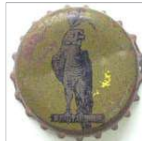
Cervesa El azor