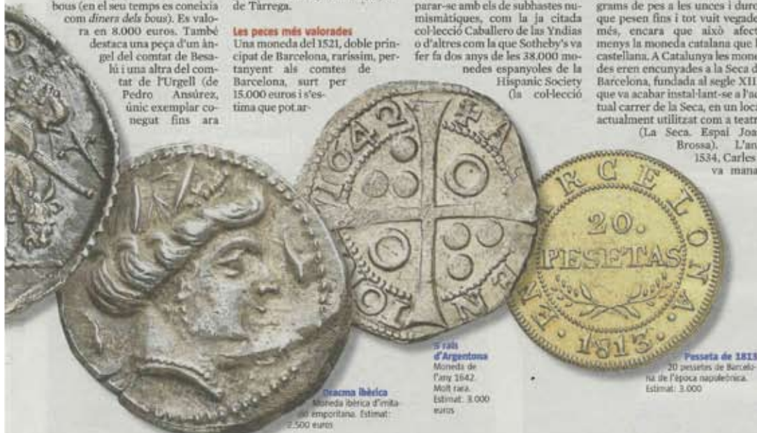
Dracma líbica Moneda líbica d'importació emporitària. Estimat: 2.500 euros

Aquestes monedes van ser l'últim episodi conegut de la moneda catalana.