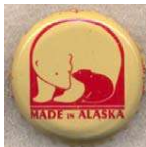
Cervesa Alaska Red on Tan

Finalitzarem amb una web on hi ha una relació de tots els col·leccionistes de taps de corona i en el que si vosaltres en sou us hi podeu apuntar: http://www.crowncaps.info/index.php