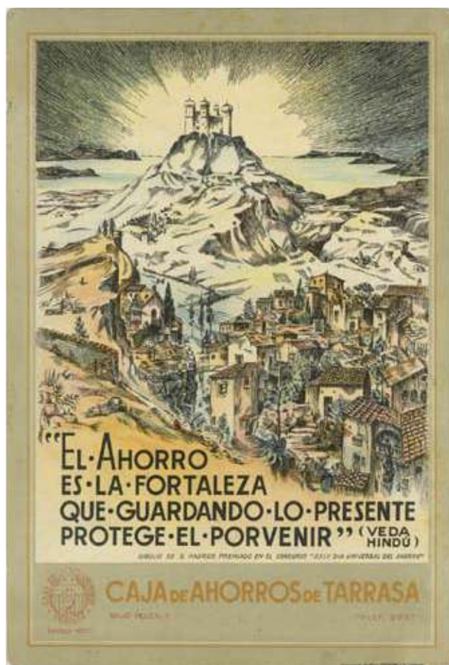
Un calendari de davantal del segle passat de Caixa d'Estalvis de Terrassa amb el dibuix de S. Padrós premiat en el XXIIIè Dia Universal del Ahorro