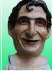
19. El Farrès o El Cèsar del Vallès

Edició limitada de set punts de filles per a col·leccionistes. 44 sèrie