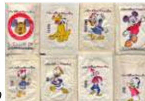
sobrets de sucre anys 60