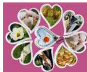
sobrets de sucre forma de cor