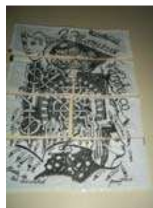
sobrets de sucre puzzle

Espero que aquest recorregut us hagi resultat prou dolç.