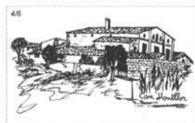
El sobre 4/6 de la sèrie