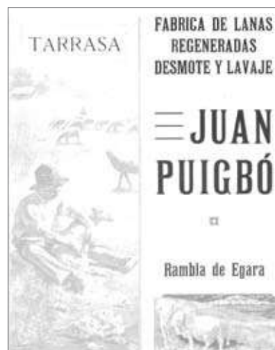
Anunci publicat a la Guia de Terrassa , editada per LLofriú i Castarlenas l'any 1907