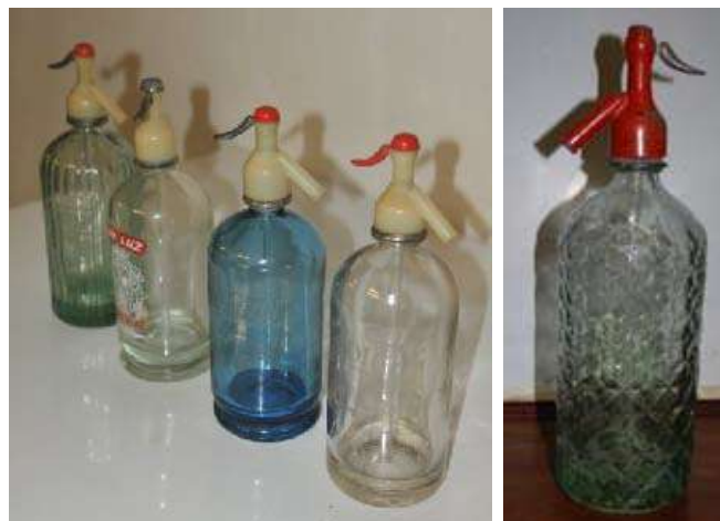
Sifons de Tenerife