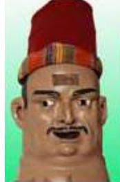
11. El Moro