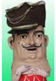
10. El Soldat

CAPGROSSOS DE TERRASSA www.col.leccionaris.com Constructor: Jordi Grau, escultor: Realització: Jordi i Josep Grau Lloc i any: Terrassa, 1986. Propositor: Ajuntament de Terrassa Alçada: 75 cm. Anys: 43 i 11. Fesit: 55 cm Pes: 42 kg. Materials utilitzats: cartó i recortament al paper Habilitat: 1986. Premi: 1986. Premi: 1986. Premi: 1986. Habilitat: representant el treball del Què de Terrassa. Grup Puigades Indústria: escultor, pintor, arquitecte i escultor. Grup Puigades Col·locació: en terrassa a les escales i es mira per la boca