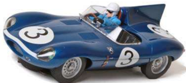
Jaguar 1957 LeMans winner