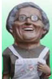
14. La Lourdes dels Amics