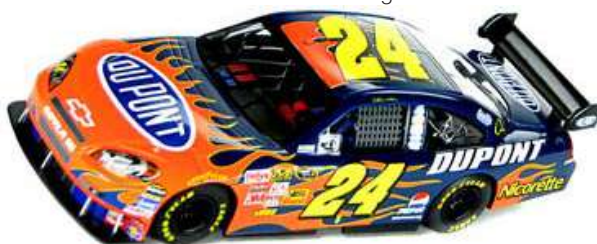
Chevrolet NASCAR COT Jeff Gordon