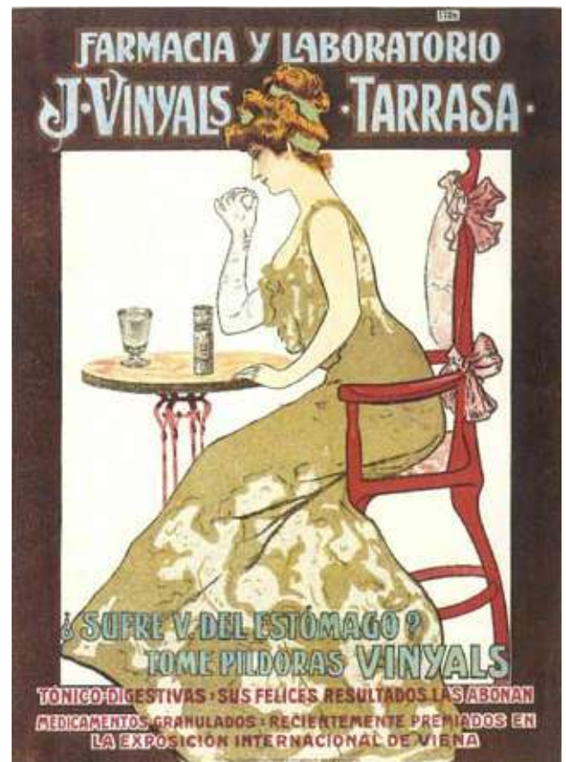
Anunci modernista al llibre: Catalunya 1000 cartells

I aturem-nos en la Fira Mercat d'Intercanvi. Ha superat el seu primer any de vida i ha mantingut el nombre de socis paradistes, entre quinze i setze. Ja l'any passat es va mantenir tot el mes d'agost, contràriament al que inicialment havíem previst, i enguany també ho ha estat. El mercat del diumenge segueix fent la viu-viu, però no arrenca com ens agradaria, ja que la proximitat d'altres mercats que vénen d'anys en ciutats relativament properes ho fa més difícil. Haurem d'anar veient què hem de fer en el futur. Que el nou curs ens porti un nou impuls col·leccionista a tots!