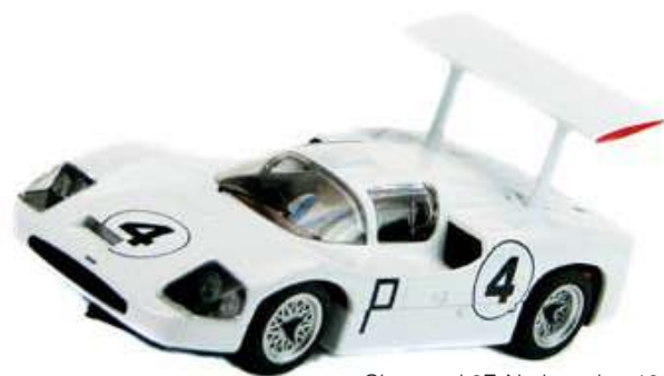
Chaparral 2F, Nurburgring 1967

I per als que no n'hagin tingut prou encara, poden entrar al Club de fans de Scalextric d'Oxford, http://www.oxonscalextricclub.co.uk/index.htm , o visitar tots aquests espais: http://www.facebook.com/scalextricpassion / http://www.scalextric.com / http://www.hornby.com / http://www.scalextricpassion.com / http://www.todoslot.es