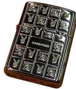
Model Zippo per commemorar el 50 aniversari de Playboy