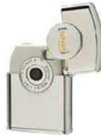
Model Zippo Càmera

Finalment, volem dir-vos que fa poc que Zippo ha obert un espai en què fins i tot ens podem dissenyar el nostre propi encenedor o fer-ne un model especial per regalar de manera personalitzada, http://www.zippo.com/customize/ , i només des de 9,95 $.