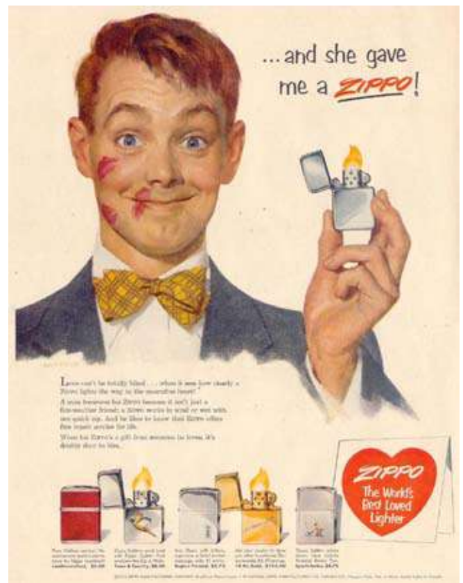
Anunci de la marca Zippo de l'any 1953