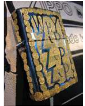
Zippo gravat pel mestre Paul Fleming