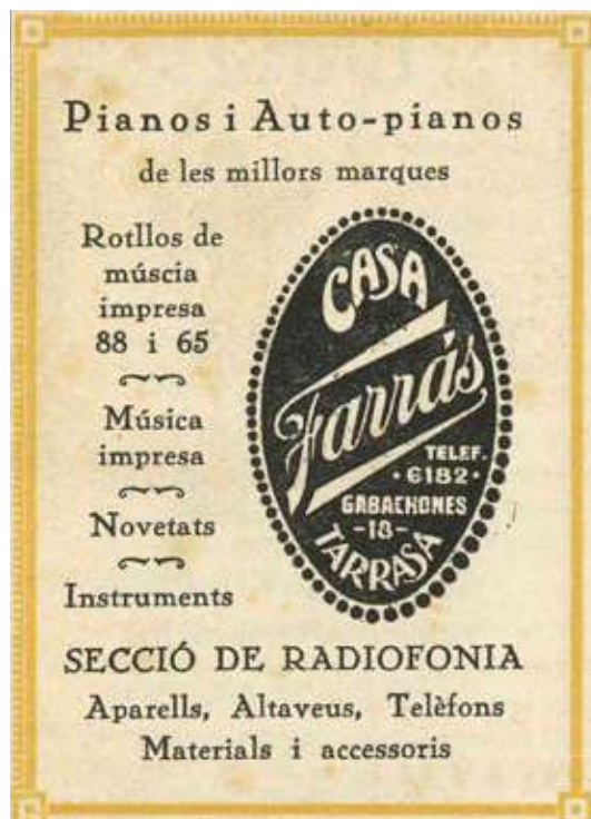
Anunci publicat a Llum Novella núm. 1 d'abril de 1925

Ens plaurà poder seguir desenvolupant les activitats socials pròpies, que ens entretenen i alhora ens permeten aprendre. Ens suposa sovint un esforç afegit, un esforç que ens rejoveneix i ens manté la il·lusió, que ens ocupa el pensament i hores a la seu social, on ens hem de trobar acollits i hem de ser acollidors, responsables de tota la gestió de l'Associació, creatius en un món complex, el de l'associacionisme, i, més en un món on s'escurcen els recursos econòmics, hem de tenir esperit participatiu. Tots som l'Associació i hem de preguntar-nos què hi podem aportar individualment i no pas què en podem treure. Amb aquest esperit, la Junta us desitja un bon any.