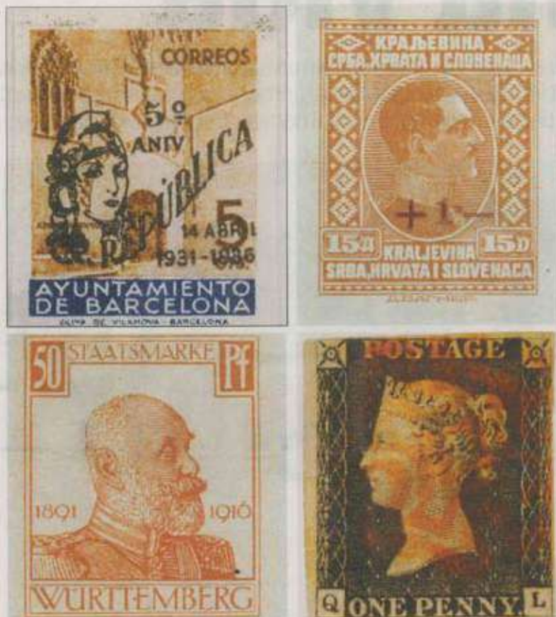
Segells de tot el món integren la col·lecció Marull. A baix a la dreta, un 'Penny black'.

El desig del mecenes, que abans havia rebutjat avantatjoses i temptado-