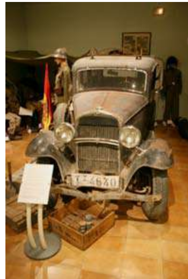
cotxe guerra civil - la trinxera

I finalitzarem el recorregut internacional amb una visita al web Alba – Abraham Lincoln Brigade Archives, http://www.alba-valb.org/ , d'una fundació fundada l'any 1975, centrada en la preservació i difusió de la història del paper nord-americà en la Guerra Civil espanyola, i que conserva un gran arxiu de la Biblioteca Tamiment de la Universitat de Nova York. Destaquem tres exhibicions itinerants: Shouts from the Wall , una col·lecció de pòsters de la guerra, The Aura of the Cause , una exhibició de fotos fetes pels brigadistes americans, i They Still Draw Pictures , una col·lecció de dibuixos fets per nens republicans a l'exili.