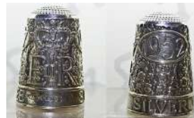
Didal d'Isabel II

I perquè vegeu que aquesta afeció és universal podem finalitzar visitant una col·lecció a l'Uruguai http://dedalesenuruguay.blogspot.com/ , una altra a l'Argentina http://www.dedalesdeargentina.com.ar/ i una de la Thimble Collectors International (TCI) http://www.thimblecollectors.com/