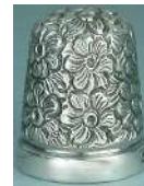
Didal d'or blanc