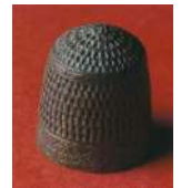
Didal romà del Castro de Vigo