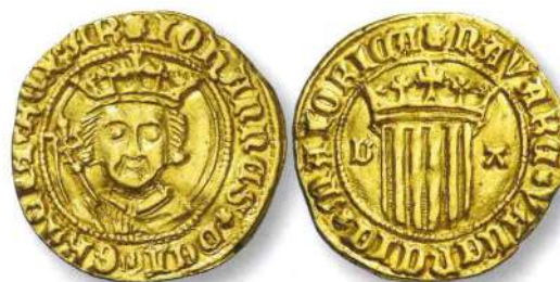
Juan II Valencia – Ducat Johani