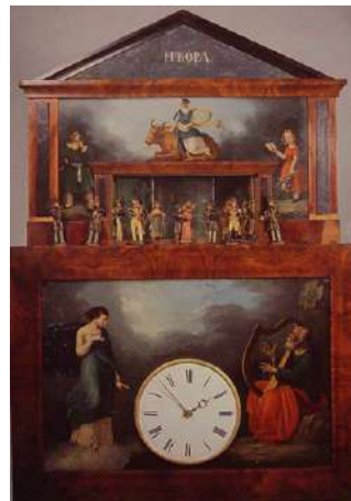
Un rellotge d'orgue, també anomenat de Flötenuhr, amb automats.

Un darrer enllaç que ens permetrà accedir a tots els webs de les marques de rellotges que existeixen actualment és: http://www.timedesign.de/dir.html