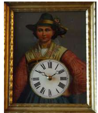
I un rellotge d'ulls