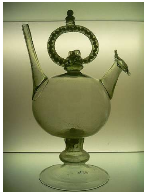
Vidre català. Càntir del segle XV elaborat per artesans del vidre.

I per finalitzar, i com a nota històrica, voldria explicar que l'origen del càntir el trobem a la zona de Mesopotàmia, on es van fer els primers càntirs vidriats sobre el tercer mil·lenni abans de la nostra era”.