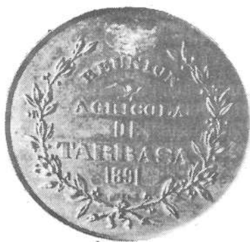
La medalla editada per l'Institut Català de Sant Isidre amb motiu de l'Exposició Regional Agrícola del 1891, és la medalla terrassenca més antiga que es coneix.

Després d'aquests preàmbuls passem ja a l'inventari per ordre cronològic.