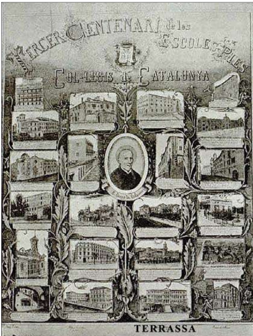
Gravat dedicat als centres docents de les Escoles Pies de Catalunya, realitzat per un altre dels grans cal·ligrafs escolapis, el pare Josep Gironés i Clapers (Moià, 21 de febrer de 1882 – 8 d'agost de 1963)

Posteriorment, formà part de la primera comunitat que encetà el projecte del col·legi d'interns escolapis de Sarrià, on va morir el 3 de febrer de 1904, a punt de complir els setanta anys.