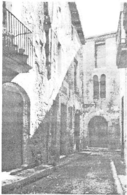
TERRASSA. Barrio antiguo. Calle de Cantarer.

Carrer de Cantarer. Al fons Cala Vitona, on va nèixer el totògraf Jaume Altimira. Fou ensorrada el 1952 per ampliar la Caixa d'Estalvis i començar el carrer de Cantarer amb el carrer del Vall. El finestral gòtic pot veure's avui a la Barata