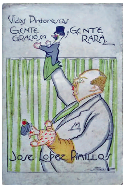
Vidas pintorescas. Gente graciosa y gente rara, de José López Pinillos, editada el 1920

Tal com ja vaig exposar a la separata 228, a partir de l'1 de desembre de 1907 Lluís Bagaria i Bou (Barcelona, 29 d'agost de 1882 — l'Havana, 26 de juny de 1940) va presentar una col·lecció de cent caricatures de personatges terrassencs a la botiga de Pere Sabater i Armengol (Terrassa, 1 de gener de 1866 — 31 d'octubre de 1938), al carrer de Sant Pere, 40.