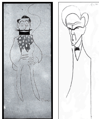
Caricatures del pintor Tomàs Viver i Aymerich (Terrassa, 23 d'abril de 1876 — 8 de gener de 1951) i d'Antoni Badrinas, realitzades per Bagaria. Obres que formaren part de l'exposició de 1907

Comentaris afins als que aparegueren publicats al setmanari La Creuada del 14 de desembre de 1907, firmats per Juno d'Argós: «(...) jo he vist com la rialla rublerta de picardia de l'autor s'encomanava a la multitud i aquella rialla esclatava potent, jo he vist sortir de l'exposició a la gent alegre i burleta (...) quina obra tan greu heu fet entre la nostra gent, ioh Bagaria! Heu fet riure, heu encomanat lo vostre bon humor, fins a aquells homes de posa seriosa y encartonada, fins als tristos, als tristos d'ànima.»