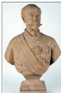
Bust en terracota del general carlista Juan Nepomuceno de Orbe y Mariaca, firmat i datat a Barcelona el 1891

Vers el 1888, una vegada va contraure matrimoni amb Carme Forn i Casajuana (Barcelona, 1860 — 28 de juny de 1930), es va establir novament a Barcelona, al carrer Colomines, 2, on, entre d'altres, obrà una figura al·legòrica de la indústria per a la casa Regàs de Mataró i que s'havia de col·locar a l'estand que aquesta firma instal·là a l'Exposició Universal de Barcelona; un bust i un de cos sencer retratant el banquer