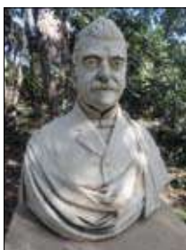
Bust d'Evarist Arnús i de Ferrer (1888). Parc de Can Solei i Ca l'Arnús, Badalona

drosa al seu catàleg comicocrític de l'exposició: « Lo mismo veo á la Virgen en este busto de mármol, que á una chica que los toros contempla desde su palco ». Aquell mateix any realitzà Al·legoria del segle XIX per a les oficines centrals de la companyia de ferrocarrils París-Lió-Mediterrània. El 1883 presentà un grup d'obres a l'Exposició Local de Terrassa, entre elles una Verge, una crucifixió i uns quants bustos de personatges coneguts. Dos anys després, el 1885, encara treballant a París, obrà un Sant Josep per a l'església parroquial del Sant Esperit i, l'any següent, un altre per a la parroquial de Sant Martí de Provençals.