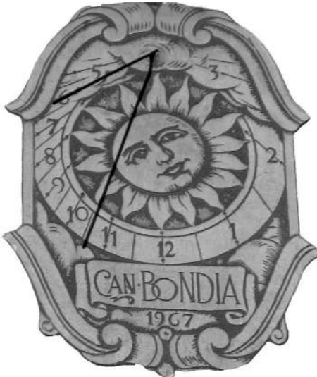
Relloige de sol de la façana de Can Bondia, realitzat el 1967 per Ferdinandus Serra

Per la seva austeritat formal, aquesta al·legoria de cànon noucentista recorda molt la iconografia emprada per l'escultor neoclàssic Valeriano Salvatierra Barriales (Toledo, 14 d'abril de 1789 — Madrid, 24 de maig de 1836) a l'hora de realitzar l'escultura que, el 1827, es va col·locar a la façana de Velázquez, del Museu del Prado de Madrid.