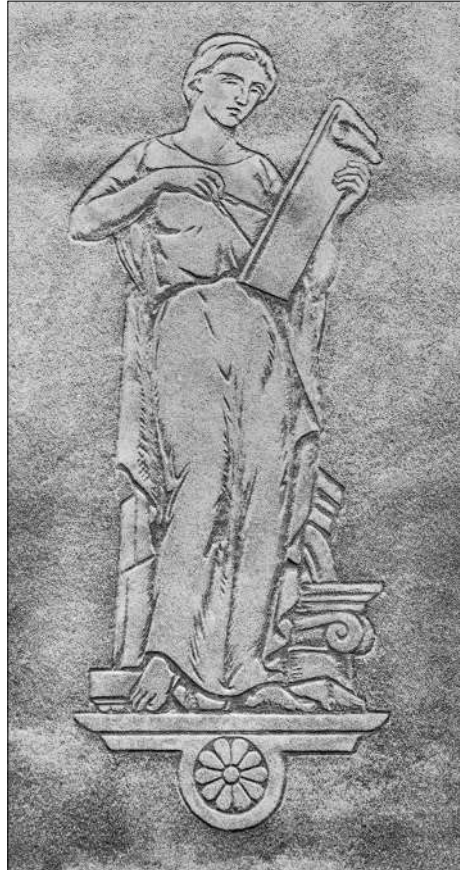
Al·legoria de l'arquitectura, esgrafiats realitzat el 1950 per Ferdinandus Serra a la façana de la finca número 150 de la rambla d'Ègara

Un altre dels treballs que Ferdinandus obrà a Terrassa fou l'esgrafiats que encara es pot veure a la façana de la finca número 150 de la rambla d'Ègara, un edifici projectat el 1949 pel mateix Joan Baca. Es tracta de l' Al·legoria de l'arquitectura , representada mitjançant una figura femenina d'estil clàssic en actitud de traçar un plànol, que s'ajuda d'un dels atributs més tradicionals en aquest tipus al·legòric: el compàs. Aquest element està relacionat amb altres disciplines i ciències, com la geometria, l'astronomia i la geografia, i també s'associa a l'esquadra, de la maçoneria, fent referència al treball intel·lectual i