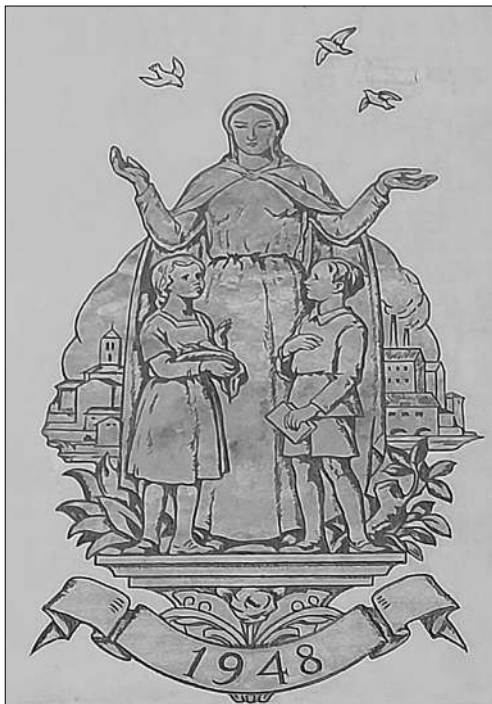
Element esgrafiat per Ferdinandus Serra el 1948, a la façana oest de l'Asil Busquets

amb magnífics treballs com els realitzats a les façanes de la casa de la vila de Martorell (1937); a la de Cal Pelagats (1940) i Can Sastre (1943), de Piera; a la de la Casa Llopart (1940), de Sant Feliu de Llobregat, o a la façana de Can Companyó de Caldes de Malavella (1970), entre molts altres. Aquestes feines s'inscriuen dins un estil marcadament noucentista inspirat en la tradició catalana de l'esgrafiat setcentista.