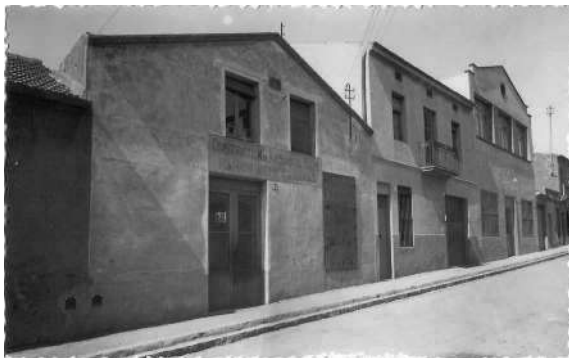
Façana de l'empresa Maquinària Ramon Reig, al carrer de la Mare de Déu dels Àngels, 21-25