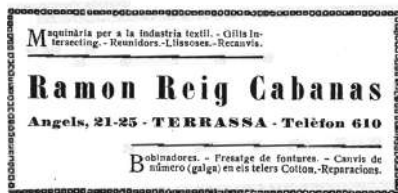
Anunci publicat a la pàgina 20 de L'Abella d'Or, 1 de gener de 1928