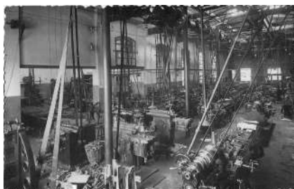
Vista general del taller de mecanitzat. Aquí es construïen les peces de les màquines tèxtils. Les màquines que es veuen són torns i planejadors o antigues fresadores