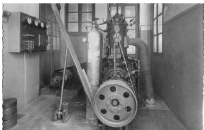
Motor de gas per a moure l'embarrat (veure foto següent), i que proporcionava el moviment a la majoria de màquines de l'empresa. També movia un generador que donava electricitat per a la il·luminació