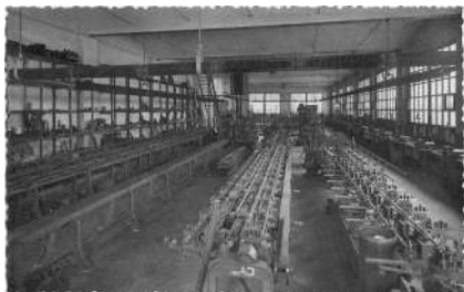
Sala de màquines de perfilar. A la dreta es veuen els cargols de banc dels operaris