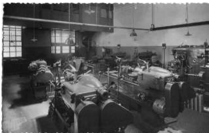
En primer terme, torns, al fons un parell de fresadores