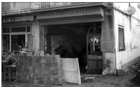
Destrosses a la façana de la ferreteria de la rambla d'Ègara, 155

el carrer del Doctor Ullés i al costat del bar Dinámico, tot mantenint l'antic local de Blasco de Garay com a magatzem.