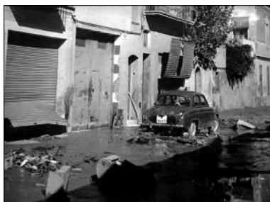
Destrosses al magatzem del carrer Blasco de Garay, 10. 1962