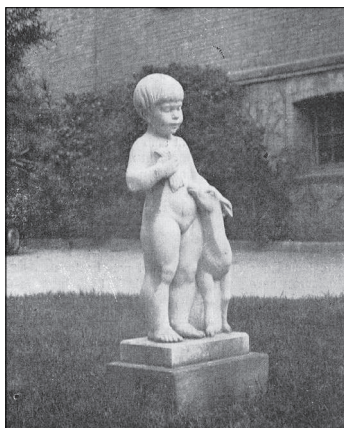
Nena amb cérvol, 1962, de Ferran Bach-Esteve i Massaneda, a la plaça de Mossèn Jacint Verdaguer, davant el lateral de l'edifici de Correus

Davant l'edifici de Correus, aquesta plaça també va estar ornada, des de 1962, amb l'escultura Nena amb cérvol , de Ferran Bach-Esteve, per a la qual l'escultor va fer servir com a model Maria