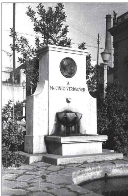
Monument erigit en homenatge a mossèn Jacint Verdaguer, 1953