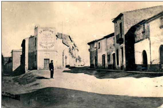
Plaça de Mossèn Jacint Verdaguer