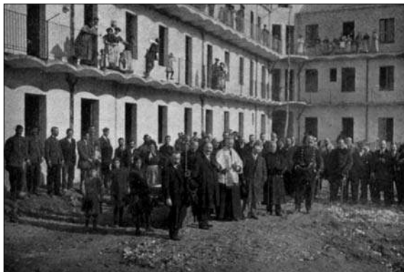
Pati interior de la caserna de la Guàrdia Civil de Terrassa, durant la cerimònia de benedicció, el 12 de gener de 1912