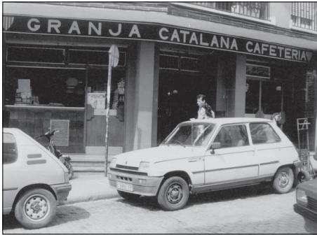
Façana de la Granja Catalana, anys vuitanta