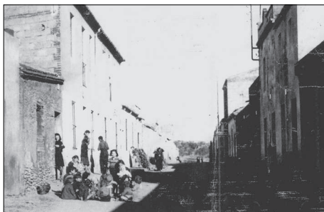
Carrer de santa Magdalena, anys cinquanta

En arribar a Terrassa, el matrimoni es va establir al carrer de Santa Magdalena, 136, a prop de la carretera de