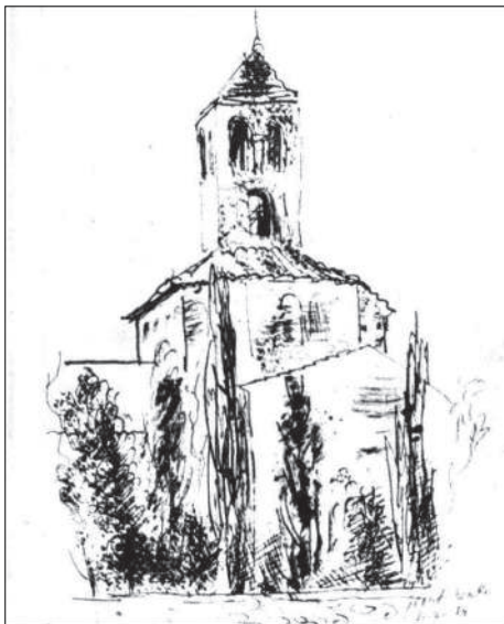
Dibuix realitzat per Nikolai Gloutchenko, reproduït a la pàgina 7 de la revista Mundo Gráfico, del 12 de setembre de 1934. Un dibuix que l'artista ucraïnès va fer especialment per a aquesta publicació