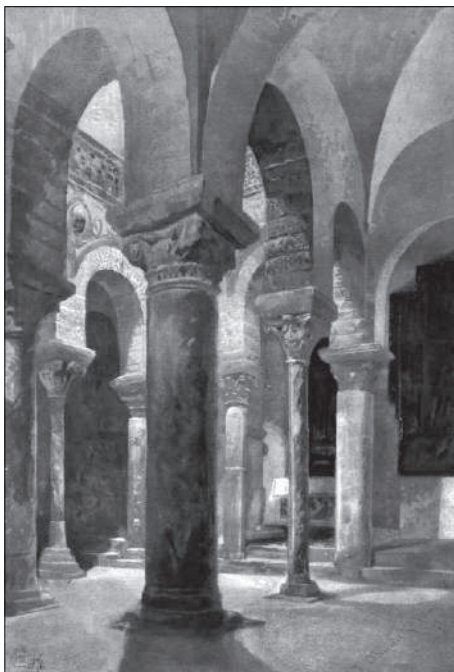
Aquarel·la realitzada per Frederic Brunet i Fita que reproduïx l'interior de l'església de Sant Miquel, publicada a la pàgina 55 de la revista Àlbum Saló, del 19 de desembre de 1897

Per últim, reproduïm una ploma dedicada a l'església de Santa Maria realitzada pel pintor ucraïnès Nikolai Gloutchenko (Dnipropetrovsk, 4 de setembre de 1901 — Kíev, 31 d'octubre de 1977), que va visitar Terrassa l'estiu de 1934, invitat pel seu amic, l'escriptor Ferran Canyameres i Casamada (Terrassa, 23 de gener de 1898 — Barcelona, 27 de setembre de 1964). Aquest dibuix va sortir publicat a la pàgina 7 de la revista Mundo Gráfico , a la seva edició del 12 de setembre de 1934, acompanyant la crònica que sobre el pintor va escriure Josep Gaya i Picón (?— Barcelona, 15 d'octubre de 1936), junt amb les fotografies del pioner del fotoperiodisme Alessandro Merletti i Quaglia (Torí, 1860 — Barcelona, 10 d'agost de 1943).