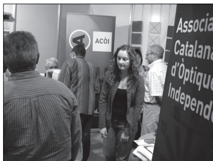
Jornada organitzada per l'Associació Catalana d'Òptics Independents, octubre de 2006.