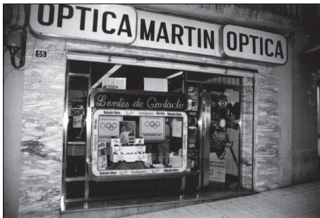
Aparador d'Òptica Martín dedicat a la ciutat de Terrassa com a seu olímpica el 1992.