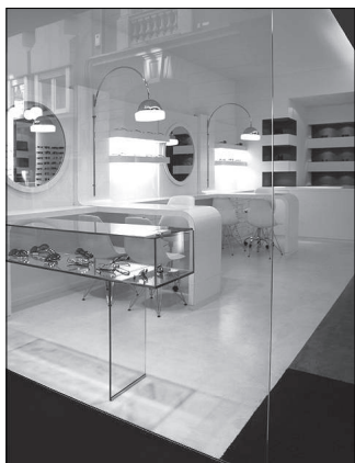
Reforma interior d'Òptica Martín, a càrrec de l'empresa sabadellenca Espai.s Interior, 2010.