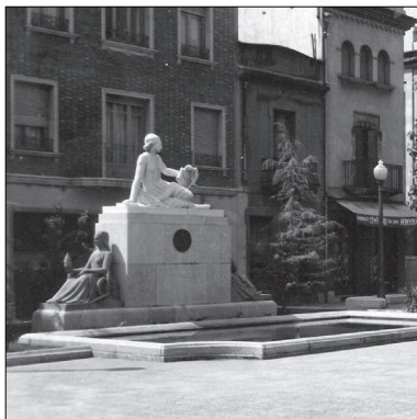
Monument a Alfons Sala, de Frederic Marès i Deulovol. Obra Inaugurada a la Plaça Vella el 30 d'abril de 1950