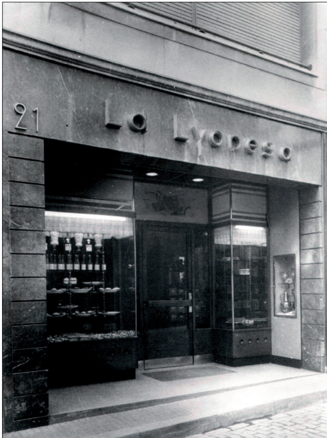
Confiteria i pastisseria La Lyonesa. Fotografia: Carles Duran i Torrens, 1950.

patrimoni a protegir, ja que es tractava d'un dels pocs exemples d'estil racionalista projectats per Ignasi Escudé a la ciutat. Aleshores, tècnics de l'Ajuntament van realitzar, el 22 de juny del 2009, una visita a la botiga, de la qual es derivà la paralització de les obres i es va obligar la promotora encarregada a tornar a reconstruir l'aparador. Actualment, aquest establiment acull un comerç de complements denominat Bosanova, firma creada el 1986.