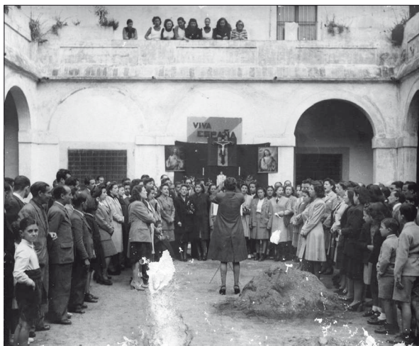
Actuació de la Massa Coral de Terrassa al pati de la presó, setembre de 1958.