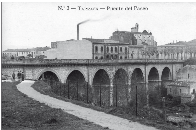
Presó del Partit Judicial de Terrassa sobre el pont del Passeig. Postal editada el 1910 per Josep Boixadera i Ponsa, i Josep Obradors i Pascual. Procedència: Rafel Comes i Ezequiel.

Continuació del núm. 198, maig – juny de 2012