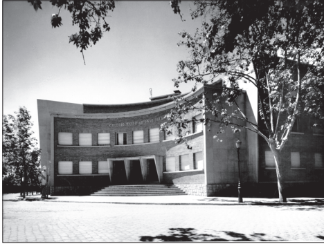
Façana principal de l'antic Col·legi Major Alfons Sala, situada al xamfrà del carrer de Colom i de l'avinguda de Jacquard.