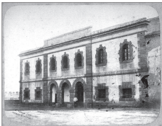
Presó de Terrassa. Fotografia: Adrià Torija i Estrich, 1883–1884. Procedència: Arxiu Tobella.

Tal com consta en la documentació consultada a l'Arxiu Històric Comarcal, l'Ajuntament de Terrassa va presentar una proposta al Govern, datada el 9 de gener de 1850, per a reparar la presó que fins aleshores havia estat ubicada