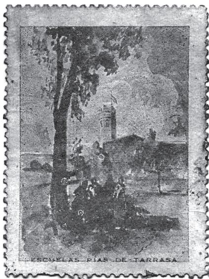
Vinyeta editada per l'Escola Pia de Terrassa, il·lustrada per Santiago Padrós, amb una vista general de la façana de migdia d'aquest col·legi. Original virat en verd. Procedència: Rafel Comes i Ezequiel.

en concret, la imatge titulada Fachada . Fou, a més, la mateixa il·lustració que es va fer servir també en algunes targetes postals i en la capçalera del paper de cartes emprat per alguns membres d'aquest col·legi.