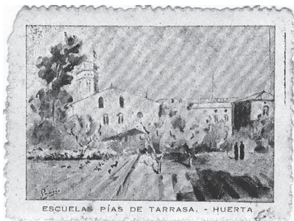
Vinyeta editada per l'Escola Pia de Terrassa, il·lustrada per Santiago Padrós, amb una vista de l'antic hort de l'Escola Pia de Terrassa, on actualment hi ha el camp de futbol. Original virat en blau.

Es tracta de vinyetes rares de trobar. Jaume Gumà i Grau (Terrassa, 18 de març de 1939), a la seva col·lecció en té quatre virades en blau, encara que la mateixa sèrie també es va editar en tres colors més: verd clar, lila i vermell tal i com apareixen a la col·lecció de Rafel Comes i Ezequiel. Atès, doncs, que no se n'ha trobat cap altra, el més probable és que es fessin solament aquestes quatre i en aquests quatre colors.