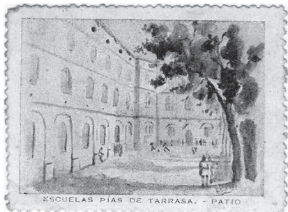
Vinyeta editada per l'Escola Pia de Terrassa, il·lustrada per Santiago Padrós, amb una vista del pati de Sant Josep de Calassanç de l'Escola Pia de Terrassa. Original virat en lila.