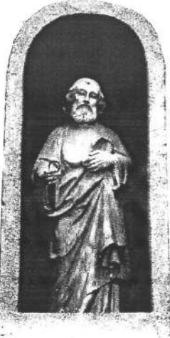
Sant Pere (70 x 24,5 cm), 1966, carrer de Sant Pere, 24. "Taller de Escultura de Arte y Religiosa Hijo de José Renalías". Fotografia: Ana Fernández, 2009.

Información , a la seva secció "Ventanal", on firmava com a Z, així com diversos ciutadans a través de cartes al director als diaris locals. Tal fou la insistència que la mateixa Associació de Veïns es veié obligada a respondre mitjançant un escrit al diari Tarrasa Información , del 4 de març de 1954, dient que s'estava treballant en pro d'aquesta causa i recomanant que es tingués paciència, tot citant literalment el consell de Felip II al seu ajudant de cambra: visteme despacio Juan que tengo prisa .