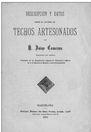
Descripción y datos sobre el sistema de techos artesonados (1884), de Jaume Comerma

El 23 de març de 1881 Jaume Comerma i Torrella (Terrassa, 10 de febrer de 1846 – Barcelona, 1 de novembre de 1887) obtingué el privilegi d'invençió d'un sistema de sostres denominat Techoscielorrasons artesano-dovelados, que havia demanat el dia 8 de febrer de l'any anterior. Aquest procediment es va conèixer a partir d'aleshores com a Sistema Comerma i es va considerar, en comparació amb els que s'havien emprat fins a aquella data, com el més sòlid, bell, elegant, econòmic i fàcil de bastir, i l'ús del qual es va generalitzar ràpidament.