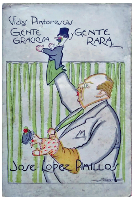
Vidas pintorescas. Gente graciosa y gente rara, de José López Pinillos, editada el 1920

Tal com ja vaig exposar a la separata 228, a partir de l'1 de desembre de 1907 Lluís Bagaria i Bou (Barcelona, 29 d'agost de 1882 — l'Havana, 26 de juny de 1940) va presentar una col·lecció de cent caricatures de personatges terrassencs a la botiga de Pere Sabater i Armengol (Terrassa, 1 de gener de 1866 — 31 d'octubre de 1938), al carrer de Sant Pere, 40.