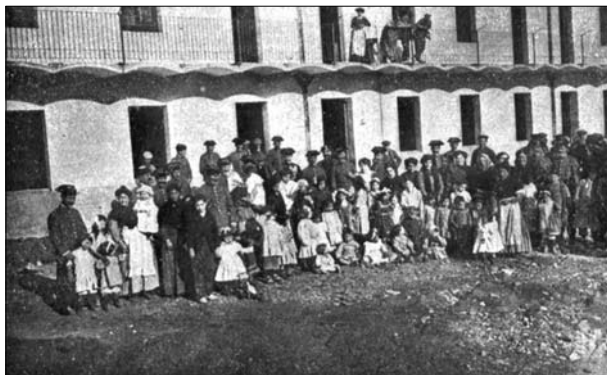
Patí interior de la caserna de la Guàrdia Civil de Terrassa durant la cerimònia de benedicció, el 12 de gener de 1912