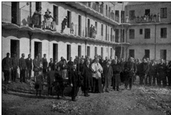
Pati interior de la caserna de la Guàrdia Civil de Terrassa, durant la cerimònia de benedicció, el 12 de gener de 1912